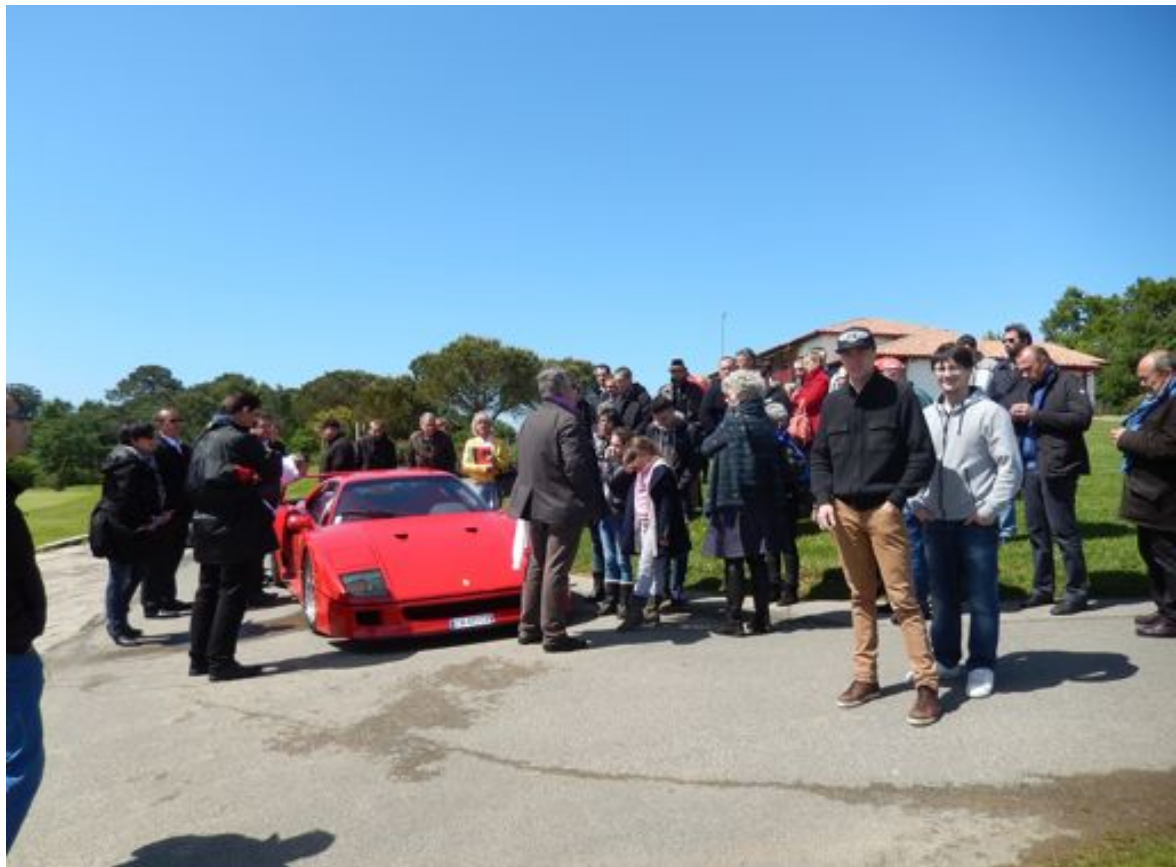
Autour d'une photo souvenir.